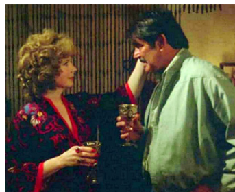
1977 RUBY (Blood Ruby) de Curtis Harrington avec Stuart Whitman