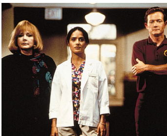
1997 THE FACULTY (The Faculty) de Robert Rodriguez avec Selma Hayek, Robert Patrick