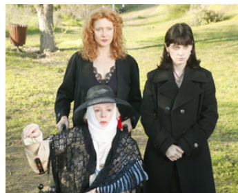
2003 FOLLES FUNÉRAILLES (Eulogy) de Michael Clancy avec Glenne Headly, Zoëy Deschanel