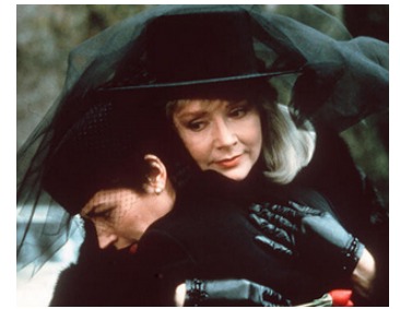
1986 MACHINATIONS (Distortion) d'Armand Mastroianni avec Olivia Hussey