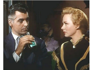
1954 VENGEANCE À L'AUBE (Dawn at Socorro) de George Sherman avec Rory Calhoun