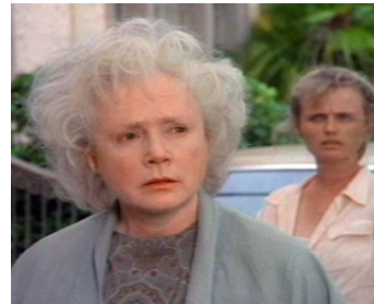
1996 THE ROAD TO GALVESTON de Michael Toshiyuki Uno avec Tess Harper