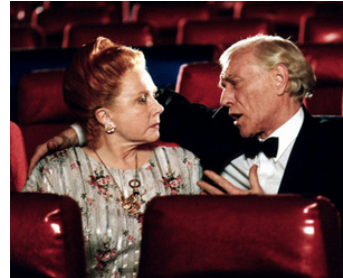
1992 DEUX DRÔLES D'OISEAUX (Wrestling Ernest Hemingway) de Randa Haines avec Richard Harris