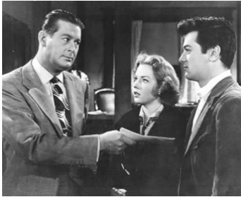
1952 NO ROOM FOR THE GROOM de Douglas Sirk avec Don DeFore, Rock Hudson