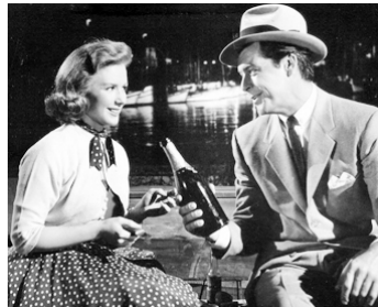
1955 LA DANSEUSE ET LE MILLIARDAIRE (Ain't misbehavin') d'E. Buzzell avec Rory Calhoun