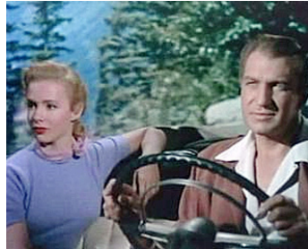
1953 MISSION PÉRILLEUSE (Dangerous Mission) de Louis King avec Vincent Price, Victor Mature