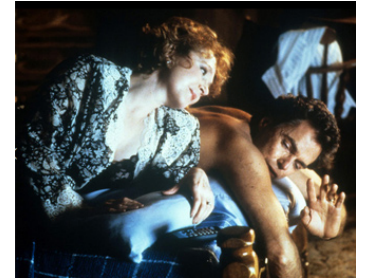
1990 TWIN PEAKS (Twin Peaks) de David Lynch avec Richard Beymer