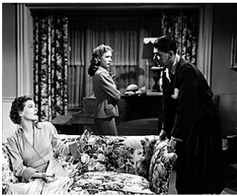
1949 LOUISE (Louisa) d' Alexander Hall avec Ruth Hussey, Ronald Reagan