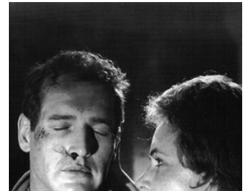
1961 L'ARNAQUEUR (The Hustler) de Robert Rossen avec Paul Newman