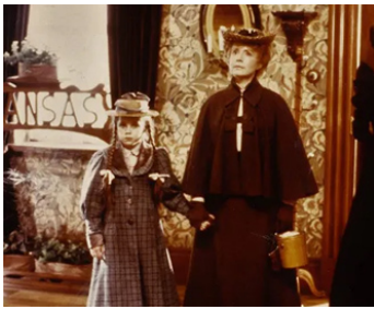
1984 OZ, UN MONDE EXTRAORDINAIRE (Return to Oz) de Walter Murch avec Fairuza Balk