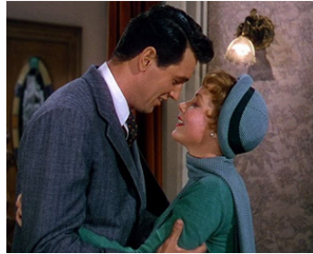
1952 QUI DONC A VU MA BELLE ? (Has anybody seen my gal ?) de D. Sirk avec Rock Hudson