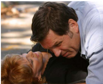
1994 CROSSING GUARD (The Crossing Guard) de Sean Penn avec Richard Bradford