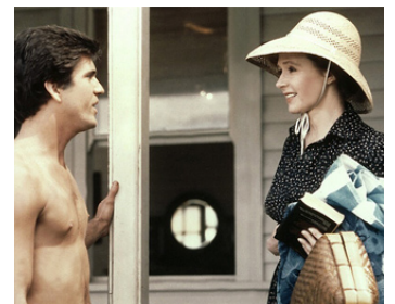
1978 TIM (Colleen McCullough's Tim) de Michael Pate avec Mel Gibson