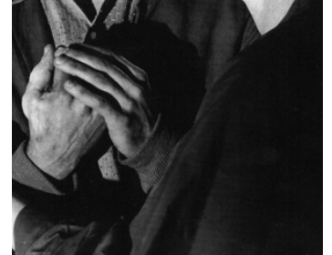
1961 L'ARNAQUEUR (The Hustler) de Robert Rossen avec Paul Newman