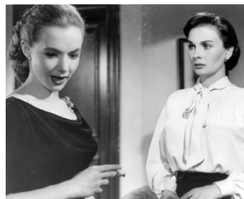
1957 FEMMES COUPABLES (Until they sail) de Robert Wise avec Jean Simmons