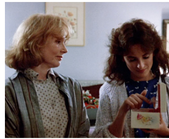
1986 LES ENFANTS DU SILENCE (Children of a Lesser Gold) de Randa Haines avec Marlee Matleen