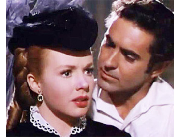
1952 LE GENTILHOMME DE LA LOUISIANE (The Mississippi Gambler) de J. Tourneur avec T. Power