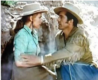
1954 LE FLEUVE DE LA DERNIÈRE CHANCE (Smoke Signal) de J. Hopper avec D. Andrews