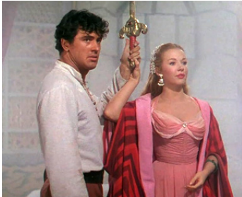
1953 LA LÉGENDE DE L'ÉPÉE MAGIQUE (The Golden Blade) de Nathan Juran avec Rock Hudson