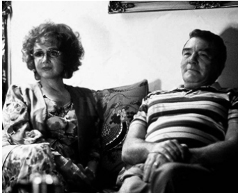
1992 L'AMOUR EN TROP (Rich in Love) de Bruce Beresford avec Albert Finney