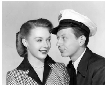
1950 LE LAITIER SONNE UNE FOIS (The Milkman) de Charles Barton avec Donald O'Connor