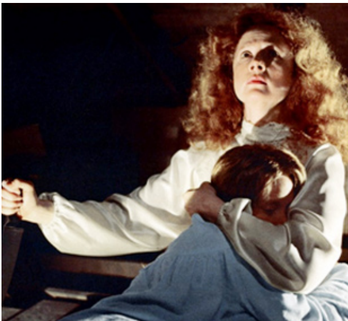
1976 CARRIE AU BAL DU DIABLE (Carrie) de Brian De Palma avec Sissy Spacek