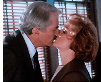
1990 LARRY LE LIQUIDATEUR (Other People's Money) de Norman Jewison avec Gregory Peck