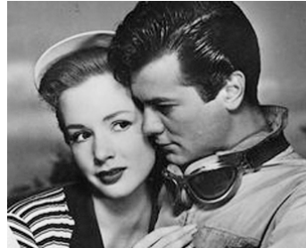
1954 LES BOLIDES DE L'ENFER (Johnny Dark) de George Sherman avec Tony Curtis