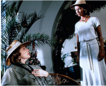
1987 RENDEZ-VOUS AVEC LA MORT (Appointment with Death) de Michael Winner avec Carrie Fisher