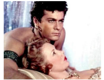
1951 LE VOLEUR DE TANGER (The Prince who was a Thief) de Rudolph Maté avec Tony Curtis