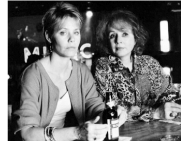
1993 REQUIEM POUR UNE ILLUSION (Love, Lies & Lullabies) de Rod Hardy avec Suzan Dey