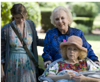
2009 ANOTHER HARVEST MOON de Greg Swartz avec Amber Benson, Doris Roberts