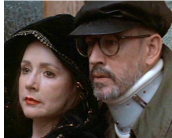
1992 TRAUMA (Trauma) de Dario Argento avec Frederic Forrest