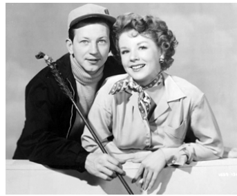
1951 FRANCIS AUX COURSES (Francis goes to the Races) d' Arthur Lubin avec Donald O'Connor