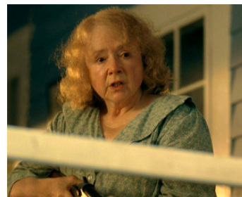
2006 HOUND DOG (Hounddog) de Deborah Kampmeier