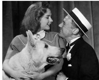
1957 KELLY ET MOI (Kelly and Me) de Robert Z. Leonard avec Van Johnson