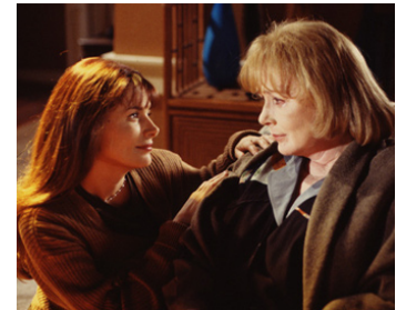
1997 LES ANGES DU BONHEUR (Venice) de Gabrielle Beaumont avec Roma Downey