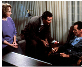
1986 LA PROMESSE (Promise) de Glenn Jordan avec James Garner, James Woods