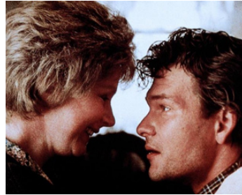
1987 LE TIGRE (Tiger Warsaw) d'Amin Q. Chaudhi avec Patrick Swayze